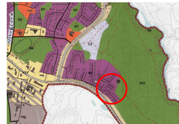
AÐALSKIPULAG FLJÓTSDALSHÉRAÐS 2008-2028 - Staðsetning merkt með rauðum hring