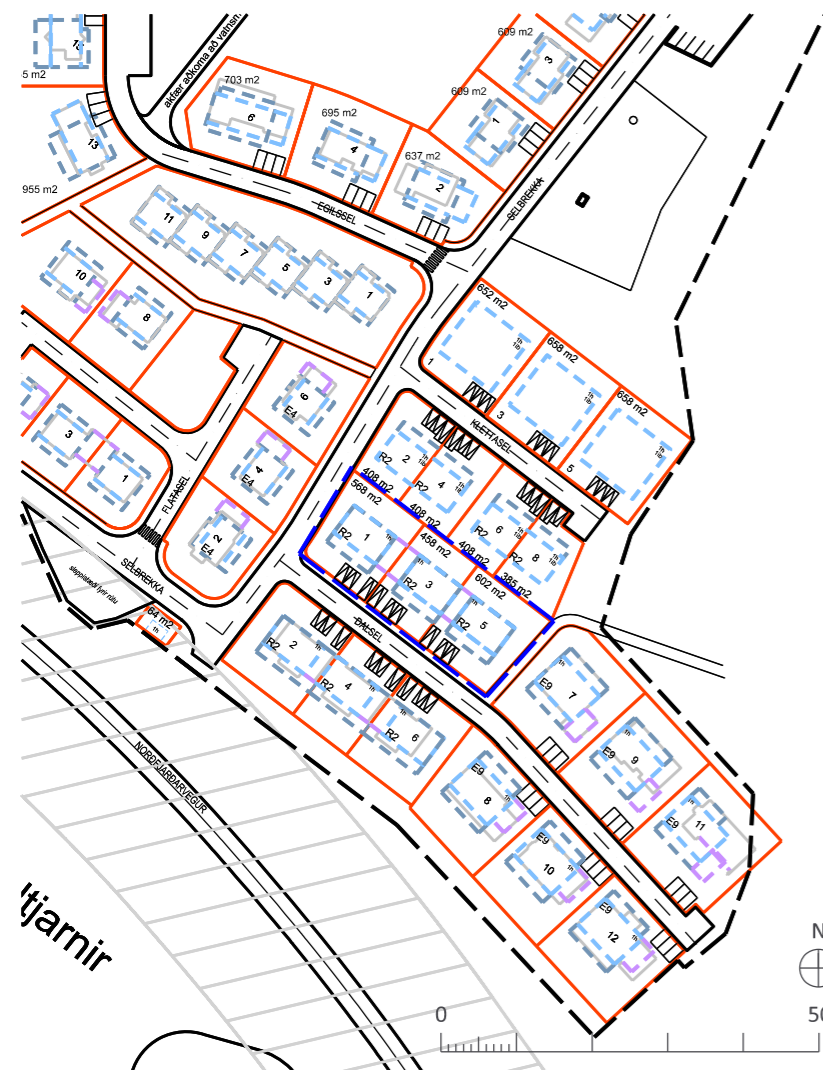
GILDANDI DEILISKIPULAG MKV. 1:1.000