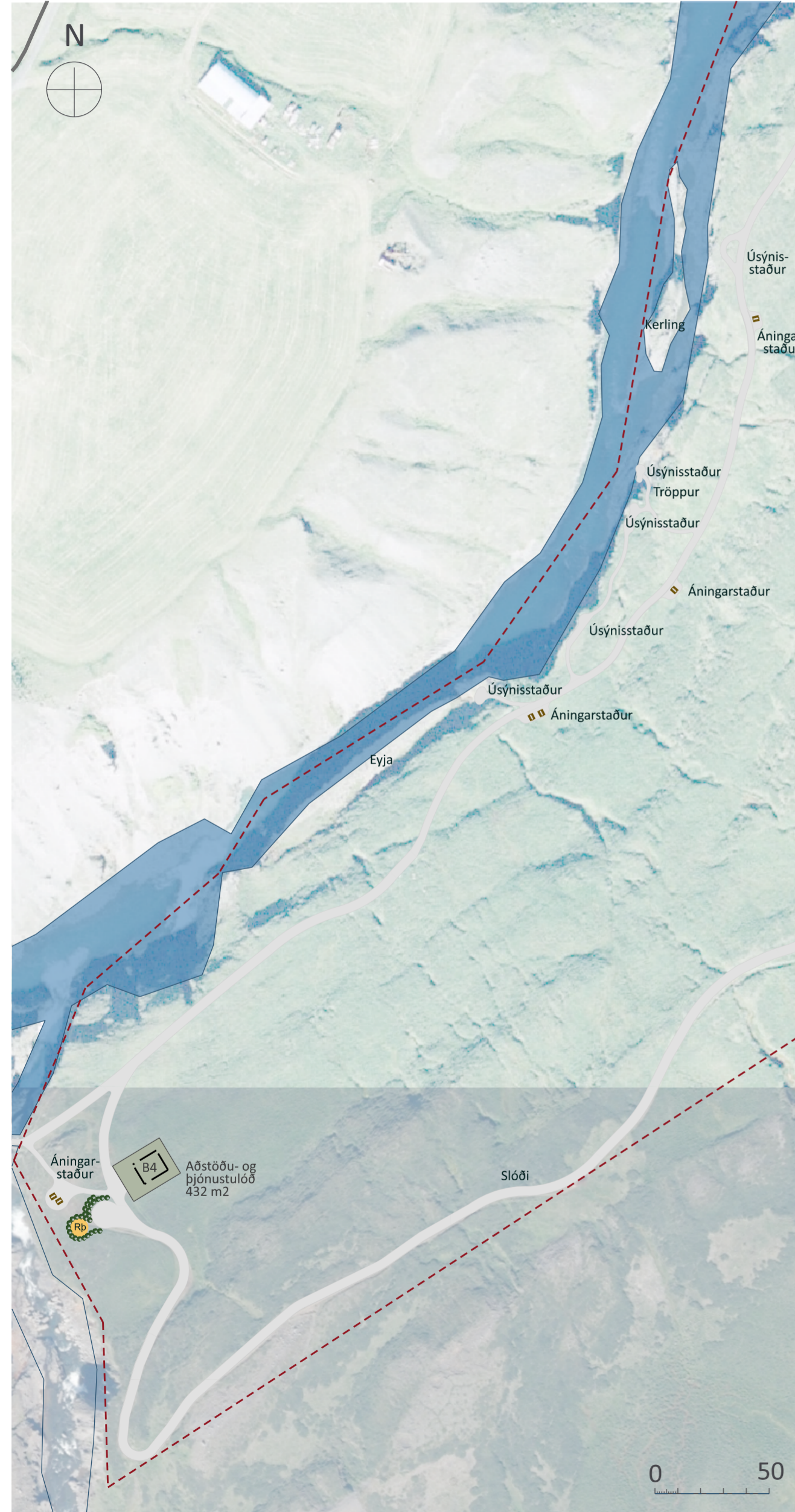
Skýringarmynd fyrir austanvert gilið mkv. 1:2.000