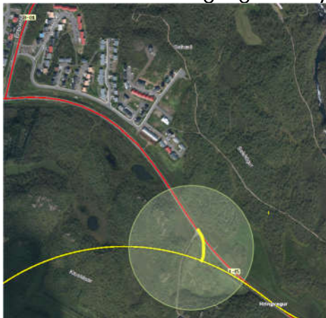
Mynd 1 Tenging milli núverandi og fyrirhugaðs Hringvegur

Á sveitarfélagsupprætti og þéttbýlisupprætti er ekki að sjá tengingu á milli núverandi Hringvegur við fyrirhugaðan nýjan Hringveg.