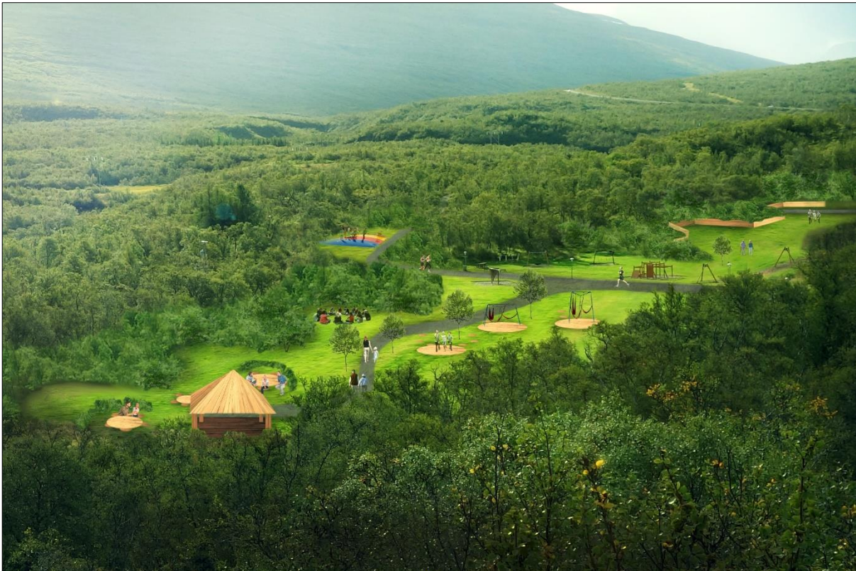
Mynd 10: Hugmyndir að afþreyingu í Vémörk. Dæmi um hönnun svæðisins (BLP)

Vémörk (Á4) – Í Vémörk er gert ráð fyrir aðal dvalarsvæði skógarins. Þangað eru góðar tengingar frá báðum bílastæðum eftir aðalstíg sem liggur í hring í skóginum. Svæðið í dag er að mestu grasflöt með nokkrum leiktækjum. Þéttur gróður er umhverfis svæðið allt en rýmismyndun á flötinni lítil. Gert er ráð fyrir að hluti svæðinu verði skipt upp í minni rými með gróðri svo skapa megi skjól fyrir hvössum vindi bæði úr norðurátt og að suðaustan. Þá er gert ráð fyrir að haldið verið eftir hluta af grasflötinni til hlaupa- eða boltaleikja þar sem ekkert hindrar umferð. Stefnt skal að því að notast við sterkbyggða runna frekar en há tré til að koma í veg fyrir mikla skuggamyndun. Gert er ráð fyrir endurbættri salernisaðstöðu, ruslaflokkun, grillskýli og leiksvæðum.