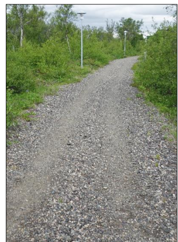
Mynd 4: Dæmi um ólík yfirborðsefni á stígum í Selskógi