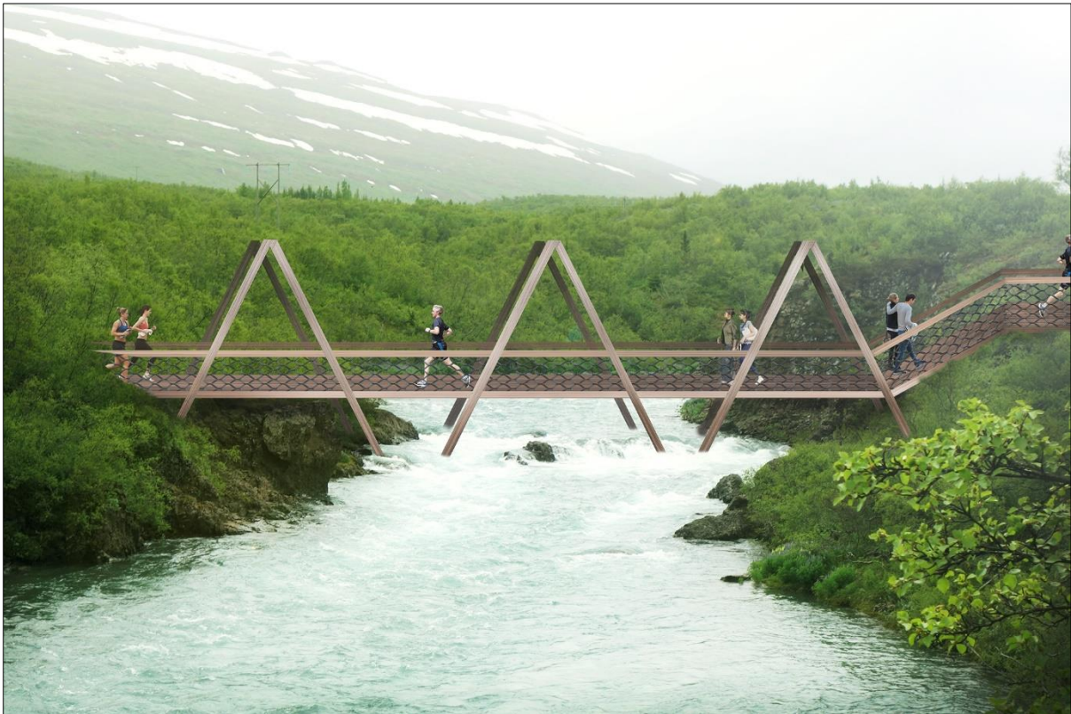
Mynd 11: Dæmi um útlit göngubrúar yfir Eyvindará (BLP)

Vegna byggingar á lóðum vísast til ákvæða þeirra laga og reglugerða sem við eiga, s.s. skipulags- og byggingarlaga, byggingarreglugerðar, skipulagsreglugerðar, reglugerða um brunavarnir og brunamál, íslenska staðla og RB-blaða Rannsóknarstofnunar byggingariðnaðarins eftir því sem við á.