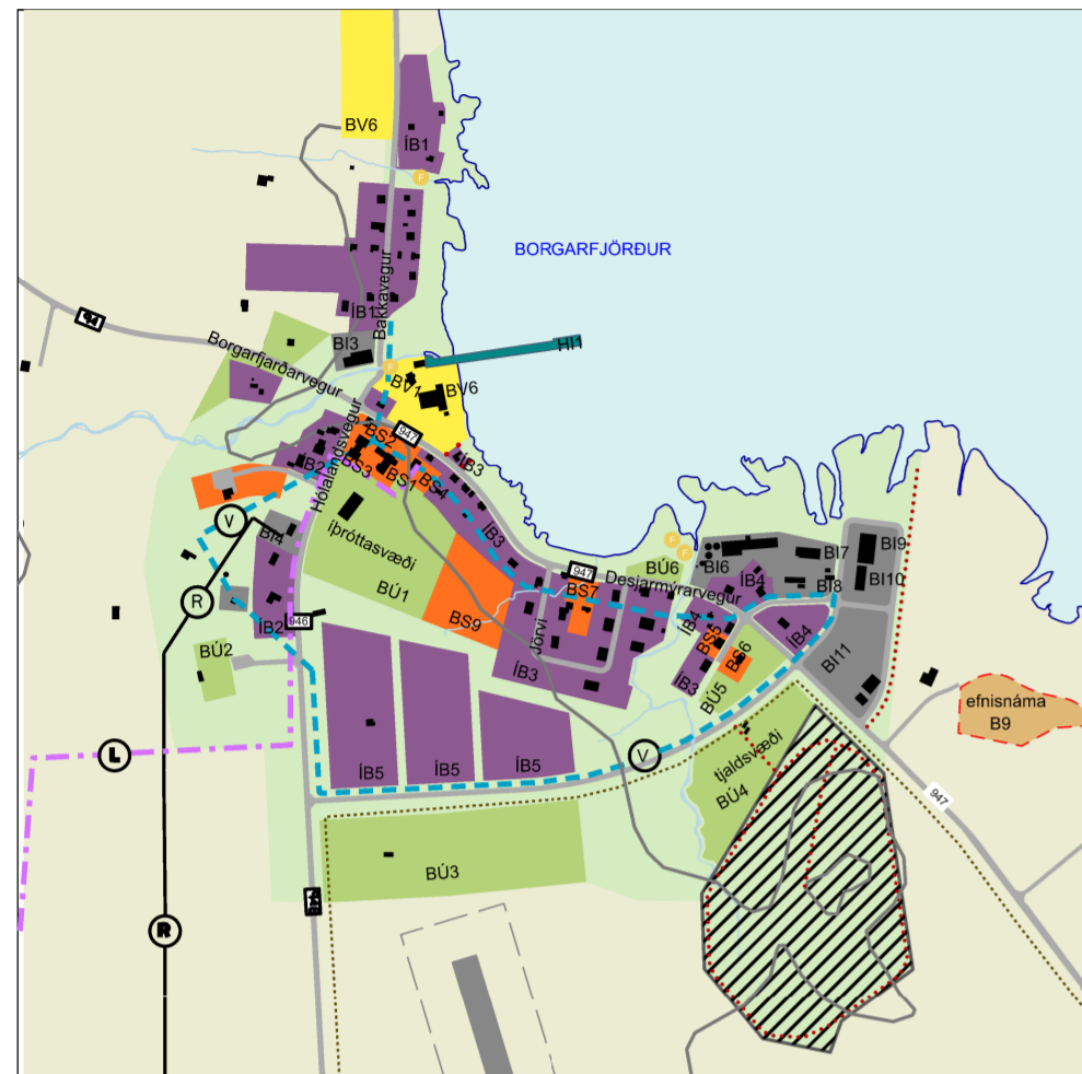
Gildandi Aðalskipulag, þéttbýlisuppdráttur staðfestur 13.05.2008 og 21.01.2021. Mkv. 1:10.000.