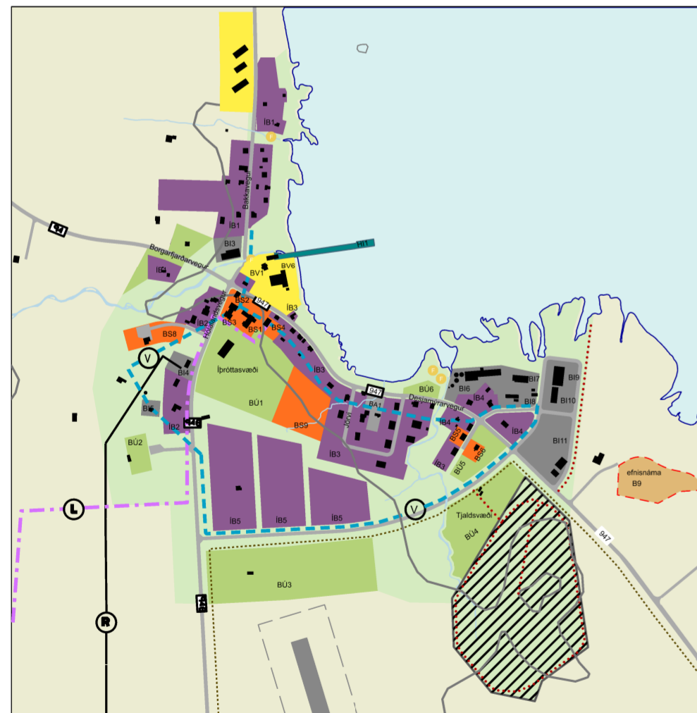
Breyting á aðalskipulagi, þéttbýlisuppdráttur. Mkv. 1:10.000.