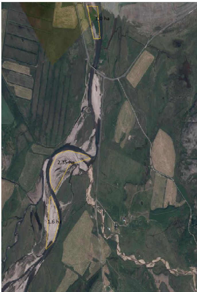
Mynd 6. Loftmynd sem sýnir fyrirhugaða staðsetningu og umfang efnistökusvæða (Sveitarfélagið Múlaþing, 2022)

Við efnistöku skal setja ströng skilyrði til varnar umhverfisspjöllum s.s. um viðhald vinnuvéla og meðferð olíu og spilliefna til að koma í veg fyrir mengun frá framkvæmdasvæðinu. Efnislager skal ekki vera á bökkum árinna heldur fluttur jafnóðum á öruggt efnisgeymslusvæði fjarri ánni. Efnistaka einungis á einum efnistökuastað í einu. Efnistaka aðeins heimil utan veiðitíma. Við veitingu framkvæmdaleyfis skal liggja fyrir umsögn Fiskistofu um framkvæmdina.