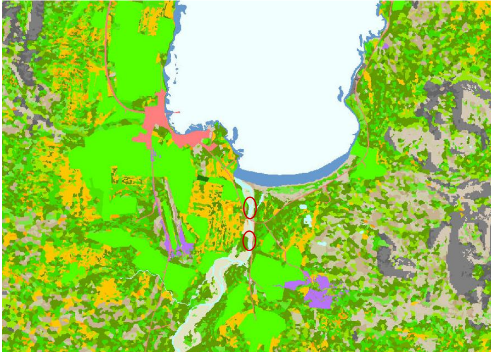
Mynd 4. Vistgerðarkort NÍ.

Á vistgerðarkorti NÍ má sjá að svæðið sem er áætlað fyrir efnistöku er skilgreint sem auravist. Auravist hefur miðlungs verndargildi það er með mjög lágvöxnum frumherjagróðri og er allrík af tegundum, einkanlega æðplöntum en þar er rýrt fuglalíf.