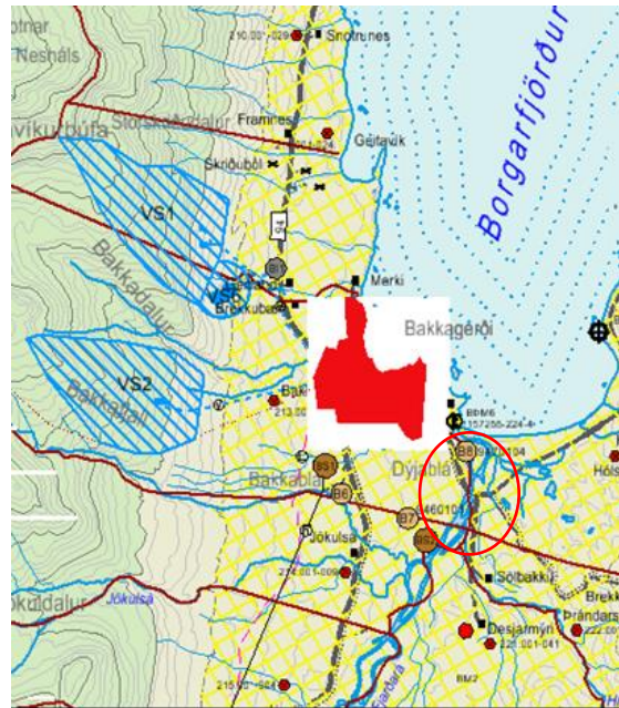
Mynd 3 Mynd úr samþykktu aðalskipulag Borgarfjarðar eystri 2004-2016, breytingarsvæðið er rauðmerkt.

Aðalskipulagi Borgarfjarðarhrepps 2004 – 2016 er breytingarsvæðið í dreifbýlinu skilgreint sem landbúnaðarsvæði og árfarvegur. Bætt er við einum efnistökuastað og náma B8 skilgreind sem opin. Svæðið sem um ræðir eru afmarkað með rauðum hring inn á mynd 3.