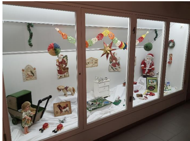
Mikið var um að vera á safninu í desember. Til vinstri: Skólahópur í jólaheimsókn Fyrir ofan: Jólagjafasýning Minjasafnsins Niðri til vinstri: Litið inn í Grýluhellinn Niðri til hægri: Inni í Grýluhellinum.