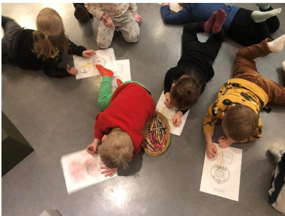
Nemendur frá leikskólanum Tjarnarskógi í einni af sínum fjórum heimsóknunum á safnið veturinn 2022-2023

Safnið hélt áfram samstarfi sínu við leikskólann Tjarnarskóg á Egilsstöðum en það felst í því allir nemendur úr næstelsta árgangi skólans koma í fjórar heimsóknir á safnið yfir veturinn. Í hverri heimsókn er tekið fyrir ákveðið þema, þ.e. húsakynni fólks í gamla daga; klæðnaður, matur og leikir barna. Í heimsóknunum er lögð áhersla á að kynna fyrir nemendum þær umgengnisreglur sem gilda á söfnum og leyfa þeim að snerta og prófa sjálf eins og hægt er. Þá hefur skapast sú hefð að safnkennari safnsins heimsæki leikskólana Hádegishöfða í Fellabæ og Tjarnarland á Egilsstöðum á bóndadag og bjóði þar upp á fræðslu um þorrann, hefðir í kringum hann og fleira.