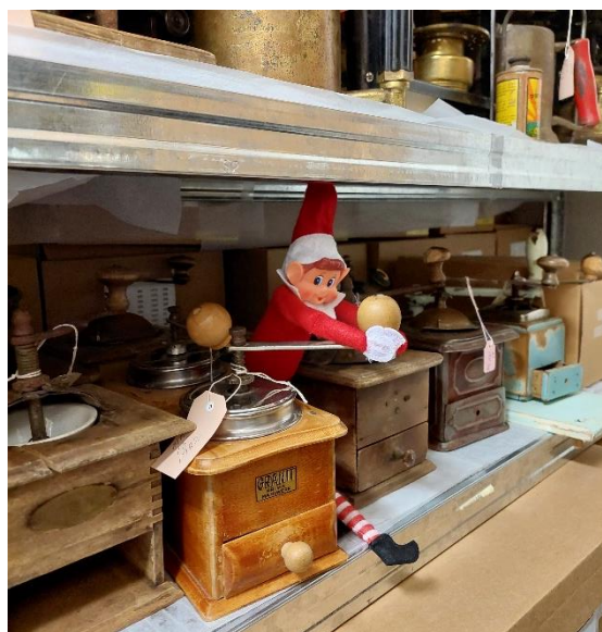
Hressir jólaálfar fóru mikinn um Safnahúsið á aðventunni. Sýnt var frá prakkarastrikum þeirra í jóladagatali á samfélagsmiðlum safnanna í húsinu.

Minjasafnið stóð fyrir margvíslegri miðlun á vef og samfélagsmiðlum safnsins og stöðugt er leitað leiða til að efla hana. Liðurinn Gripur mánaðarins hélt áfram á árinu en þar er einn gripur úr safnkosti safnsins settur í sviðsljósið í hverjum mánuði. Í tengslum við alþjóðlega safnadaginn í maí birtist grein á vef safnsins þar sem fjallað var um mátt safna til fræðslu en yfirskrift dagsins var Mikill er máttur safna. Starfskonur Minjasafnsins tóku yfir Instagram reikning FÍSOS í aðdraganda Farskóla safnmanna sem haldinn var hér austanlands í september (sjá kafla 10.7). Í aðdraganda