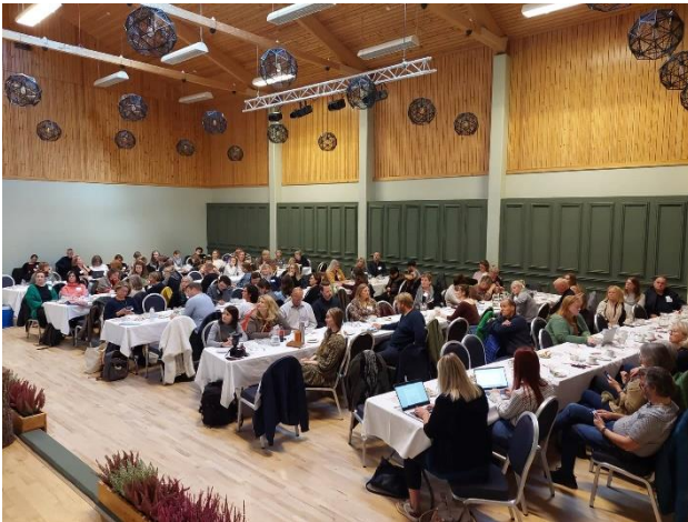
Þátttakendur í Farskóla FÍSOS samankomnir á Hallormsstað.

Eitt stærsta verkefni Minjasafns Austurlands á árinu 2022 var þátttaka í skipulagningu og framkvæmd Farskóla FÍSOS sem fram fór á Hallormsstað dagana 21.-23. september. Um 120 manns sóttu viðburðinn sem er árleg fagráðstefna safnafólks, haldin af Félagi íslenskra safna og safnmanna. Ráðstefnan hefur verið haldin víðsvegar um land í gegnum tíðina og ætíð í samstarfi við heimafólk á hverjum stað. Að þessu sinni höfðu starfsfólk