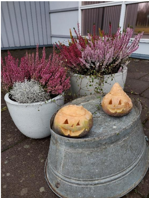
Fyrir á öldum tíðkaðist að skera andlit í rófur í byrjun vetrar. Þessar útskornu rófur tóku á móti gestum Safnahúsins í tilefni af Dögum myrkurs.

Minjasafnið tók þátt í byggðahátíðinni Dögum myrkurs, sem fram fór á öllu Austurlandi dagana 31. október til 6. nóvember, með því að bjóða upp á lengri opnunartíma, ratleik um safnið og föndurhorn.