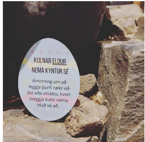
Egg í páskaeggjaleit Minjasafnsins.

Minjasafnið og Bókasafn Héraðsbúa stóðu saman fyrir páskagleði í Safnahúsinu á þriðjudegi og miðvikudegi í dymbilviku. Á þriðjudeginum var boðið upp á perlusmiðju á Bókasafninu þar sem gestum og gangandi gafst kostur á að perla páskaskraut. Á miðvikudeginum var boðið upp á óhefðbundna páskaeggjaleit á Minjasafninu þar sem leita átti að pappírs páskaeggjum og botna málshætti og orðtök. Viðburðirnir voru vel sóttir af börnum og fjölskyldum í páskafríi.