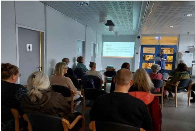
Hönnunarsmiðjan Gersemar Fljótsdals hófst með fyrirlestrum í Safnahúsinu þar sem þátttakendur voru leittir inn í viðfangefnið.

Minjasafn Austurlands kom ásamt fleiri aðilum að hönnunarsmiðjunni Gersemar Fljótsdals sem fram fór í september en markmið hennar var að draga fram sérstöðu svæðisins í hönnun og þróun handverks. Frumkvæðið að smiðjunni kom frá samfélagsverkefninu Fögur framtíð í Fljótsdal en að því komu einnig Safnbúð Þjóðminjasafns Íslands, Handverk og hönnun og Hús handanna. Smiðjan var hugsuð sem