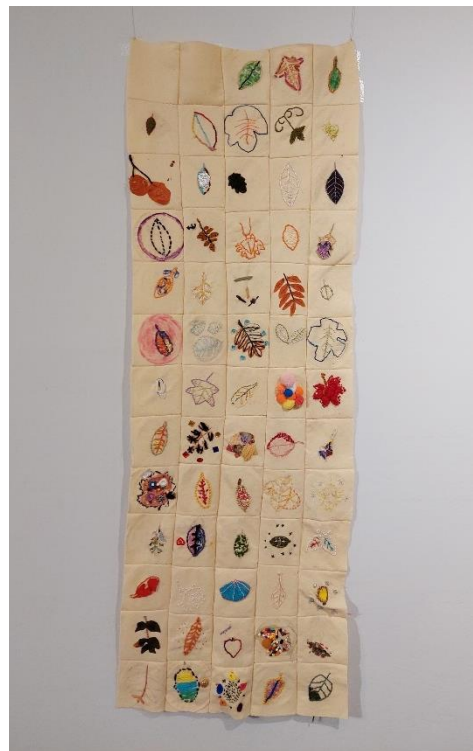
Álfkonudúkur austfirskra grunnskólabarna