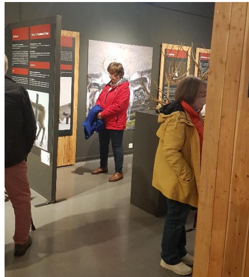
Gestir úr skemmtiferðaskipi skoða sýningar safnsins.

Undirbúningur að nýrri viðbyggingu við Safnahúsið hélt áfram á árinu. Forsaga málsins teygir sig aftur til ársins 1999 þegar þáverandi ríkisstjórn ákvað að leggja fé til