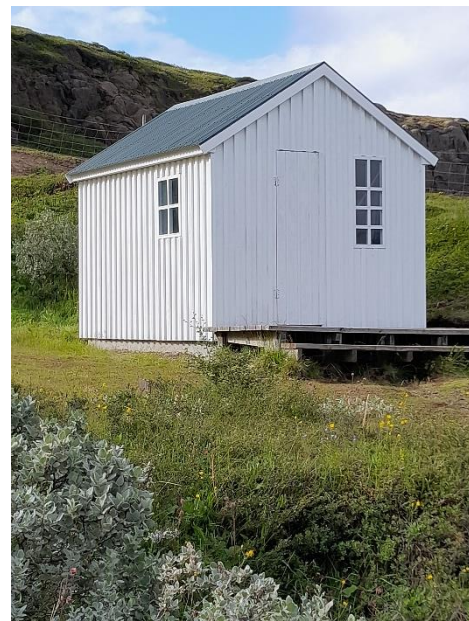
Sumarhús Kjarvals í júlí 2022.