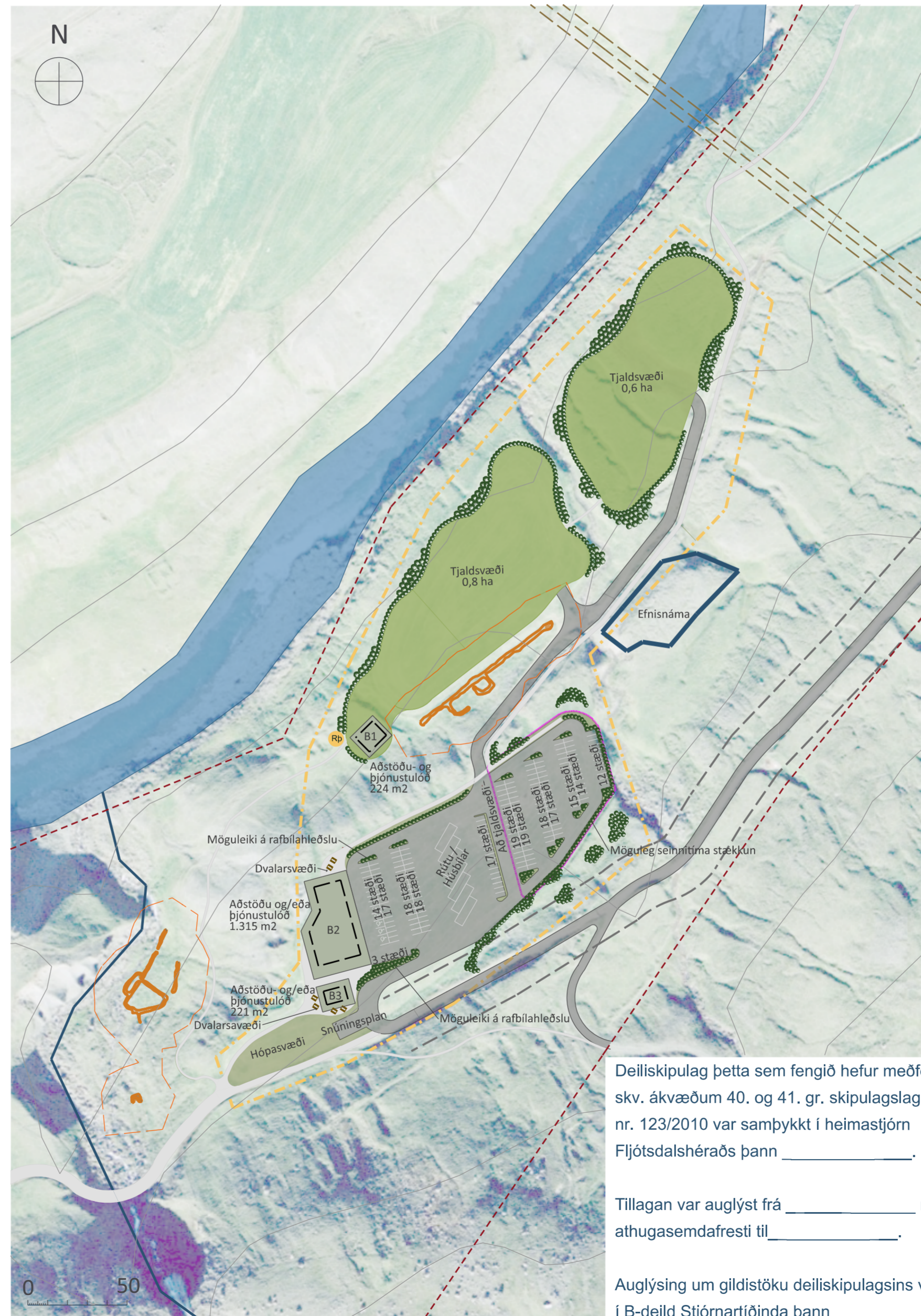
Skipulagsuppdráttur fyrir þjónustsvæðið mkv. 1:2.000