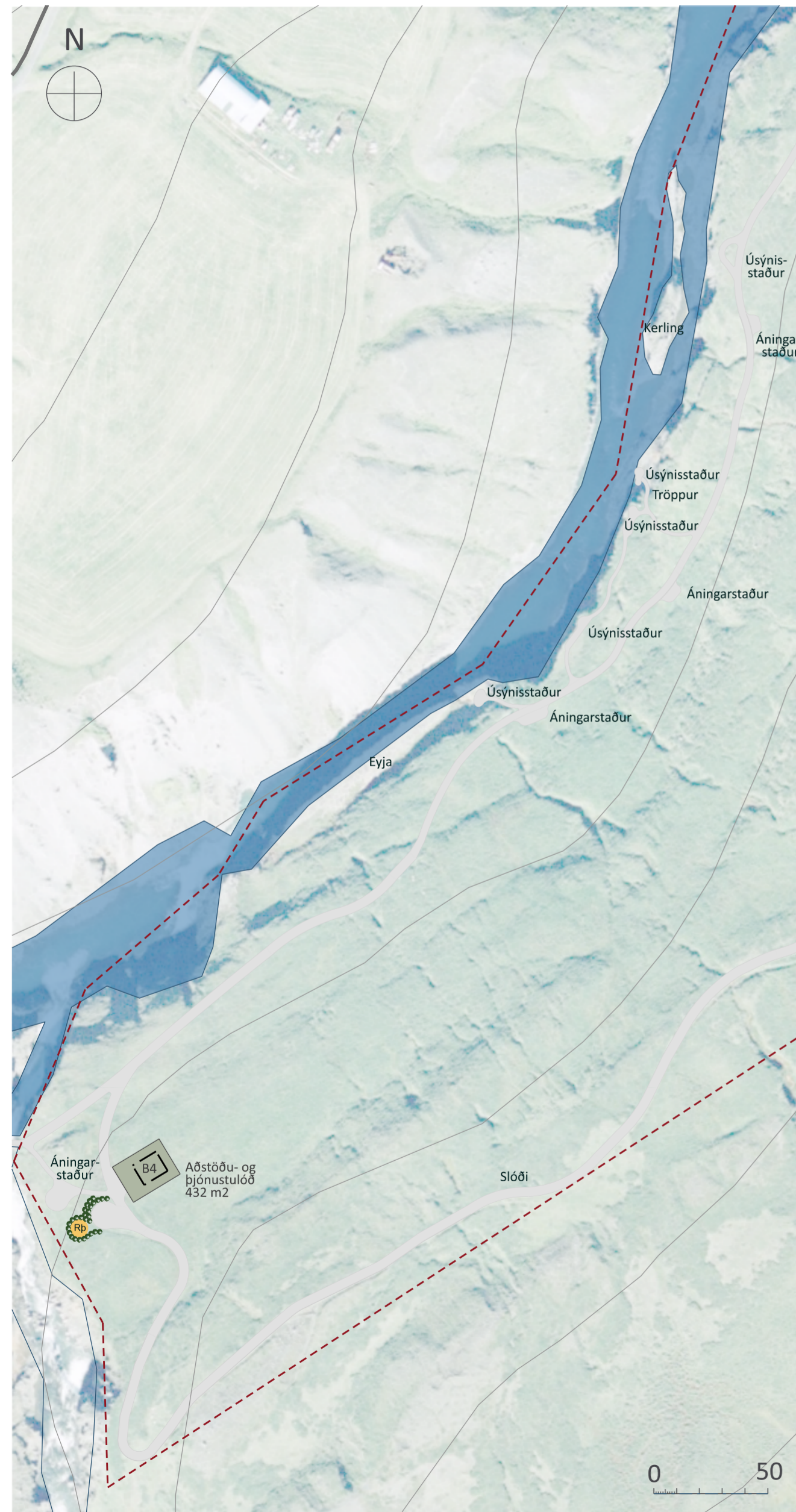
Skipulagsuppdráttur fyrir austanvert gilið mkv. 1:2.000