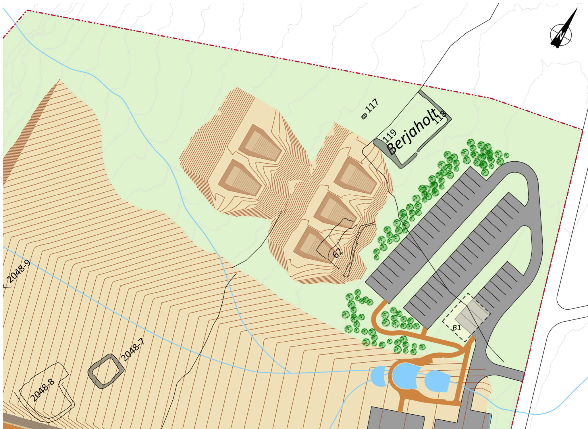
Breyting á deiliskipulagi í mkv. 1:1000