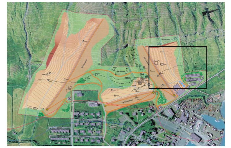
Yfirlitsmynd í mælikvarða