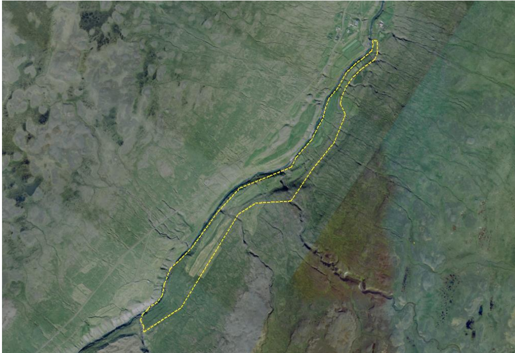
Mynd 1: Skipulagssvæðið sýnt með gulri brotalínu