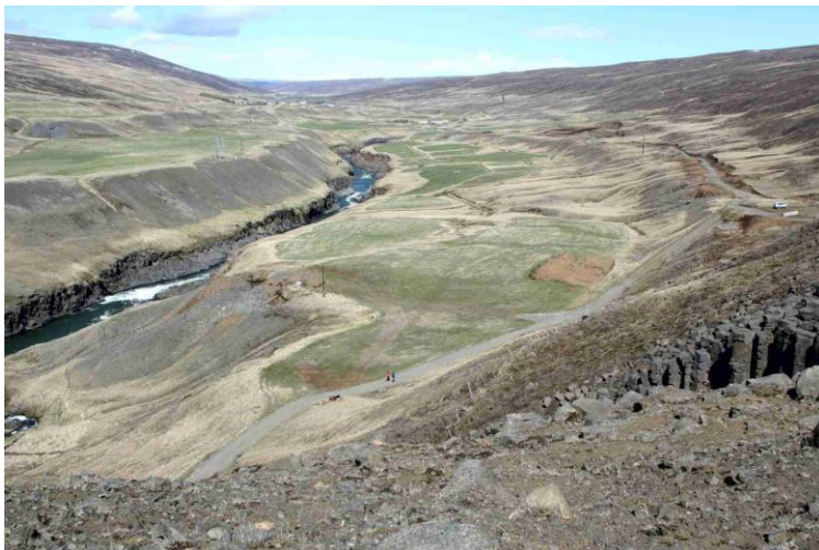
Mynd 3: Séð yfir fyrirhugað þjónustusvæði, túnin fyrir miðju myndar.

Staðsetning þjónustusvæðis er austan við Fossá, milli Jöklu og Stuðlafossvegi (sjá mynd 5). Á þjónustusvæði er gert ráð fyrir móttöku ferðafólks, bílastæðum, dvalarsvæðum, salernisaðstöðu, tjaldsvæði, afþreyingarstarfsemi, veitingasölu og öðru sem þurfa þykir til þess að veita gestum upplýsingar og þjónustu. Skipulagið gerir ráð fyrir tveimur til þremur byggingum á þjónustusvæði, einni byggingu á tjaldsvæði og síðan einni þjónustubyggingu skammt frá Stuðlagili.