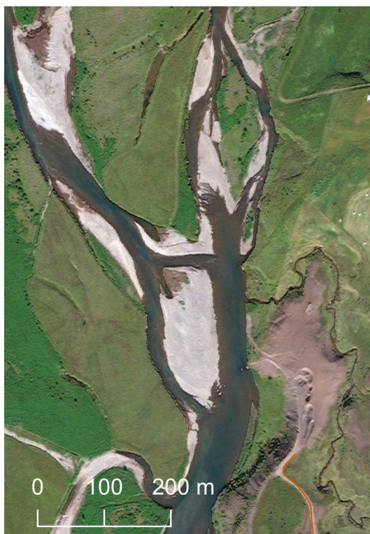
Loftmyndir af Kíðueyri, sú til vinstri frá 1994 og nýleg mynd hægra megin.